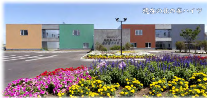
現在の北の峯ハイツ