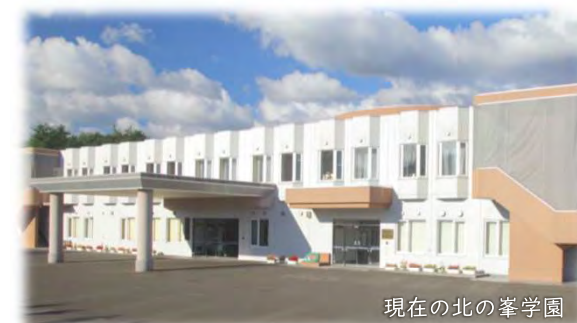
現在の北の峯学園

日時：令和6年7月25日（木）午前11時 場所：新富良野プリンスホテル1階 十勝